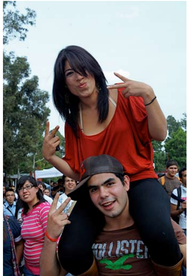
Deporte, cultura y diversión universitaria