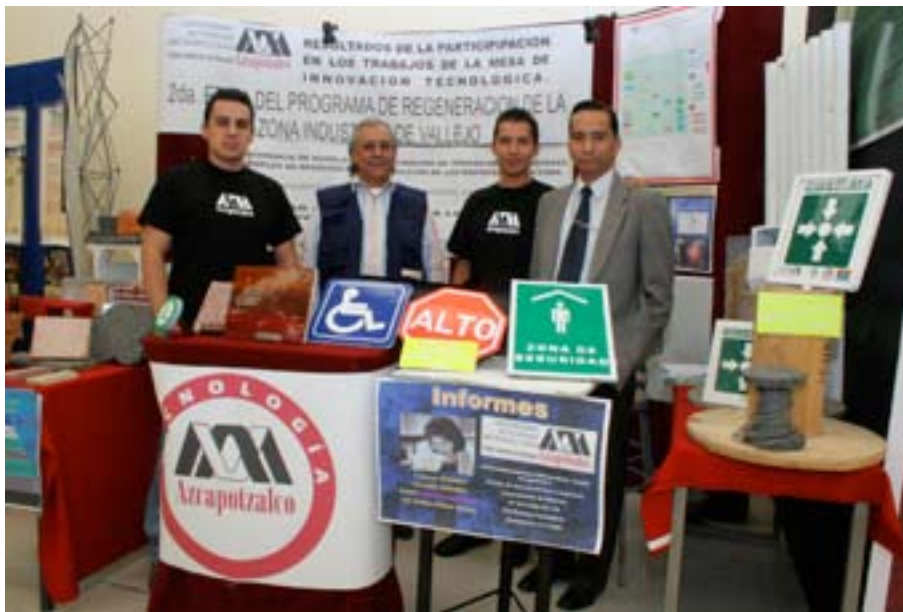
Inauguración del Centro Internacional de Negocios Azcapotzalco (CINA) el 17 de abril de 2008.