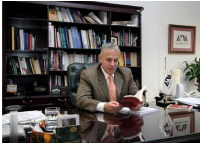
Consolidar el proyecto académico