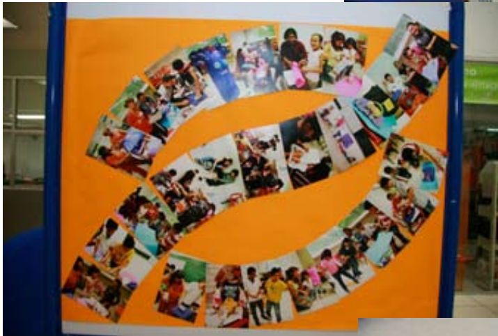
Trabajos de los niños participantes en el Programa Peraj-Adopta Un amigo@ UAM-Azcapotzalco