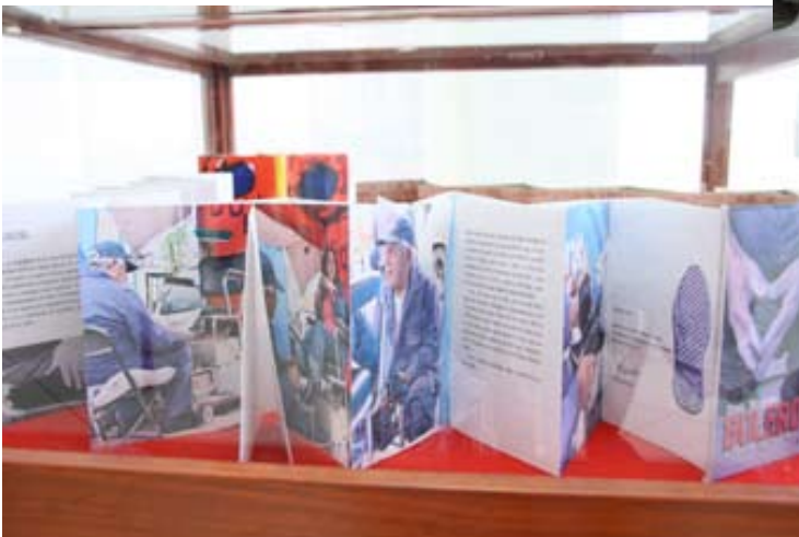
La muestra itinerante Sitting Room propicia la lectura y el contacto del espectador con los libros de artista .