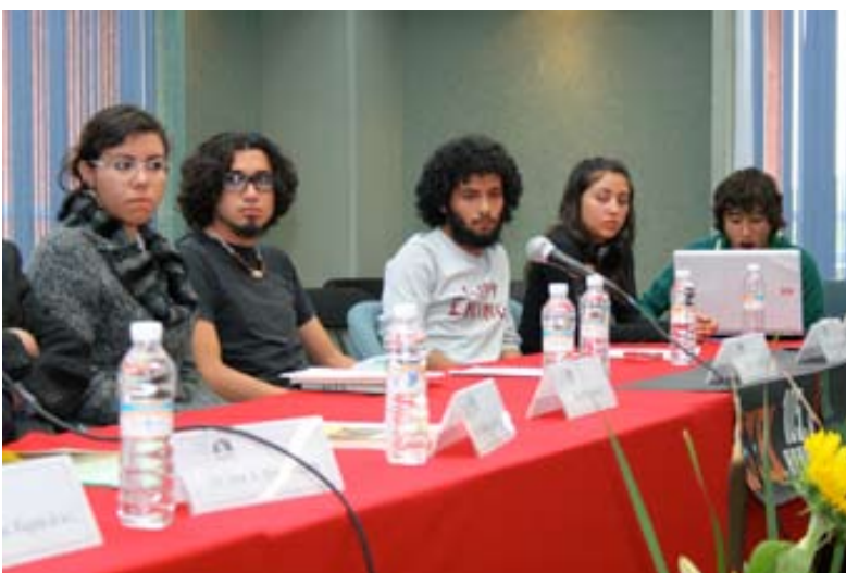
Presentación de la revista Fuentes Humanísticas , el 20 de mayo de 2008.