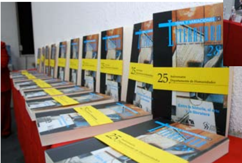
Presentación de la revista Temas y Variaciones de Literatura , número 28, el 14 de abril de 2008.